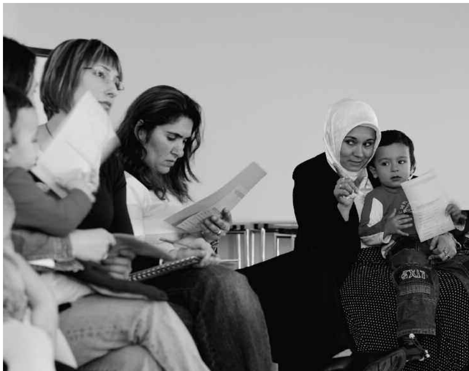
Eltern und Kinder im Kurs «schulstart+»

Ein gelungener Eintritt in den Kindergarten ist entscheidend für den zukünftigen Schulerfolg. Mit dem Projekt schulstart+ bereitet Caritas Zürich Migrantenfamilien auf diesen Schritt vor.