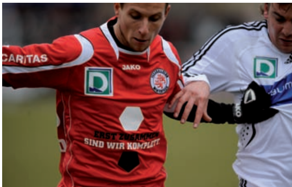
Die Trikots der FCW-Spieler werden in der Rückrunde vom Caritas-Logo und unserer Kampagne «Erst zusammen sind wir komplett.» geschmückt..

«Erst zusammen sind wir komplett», unter diesem Titel starten der FC Winterthur und Caritas Zürich das gemeinsame Projekt «Wintegration».