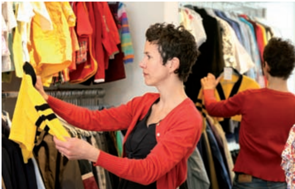
Im Caritas Laden finden sich nicht nur neue und gebrauchte Kleider zu günstigen Preisen, sondern auch Schnäppchen bei Geschirr, Möbeln, Apparaten und Büchern.

Ein Caritas Laden ist ein ganz besonderer Ort: Den Kundinnen und Kunden bietet er günstige, gute Ware, den Mitarbeiterinnen und Mitarbeitern dient er als «Startrampe» zurück in den ersten Arbeitsmarkt, und für die Caritas ist er ein wichtiges Standbein.