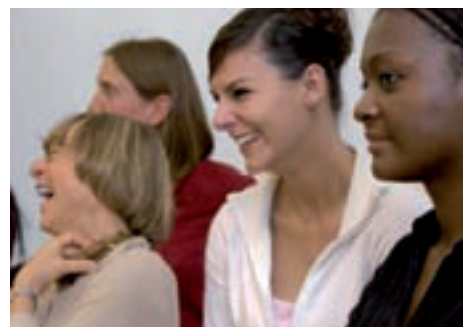
Transfer führt Menschen zusammen.

Auf vielfältige Art vermittelt «Transfer» Fach- und Hintergrundwissen zu transkulturellen Kompetenzen und stellt gleichzeitig den Transfer in den Alltag her. Die Teilnehmenden bewegen sich in verschiedenen kulturellen Kontexten, Altersgruppen und Lebenswelten. Sie fördern Prozesse bei Gruppen und Einzelnen und suchen gemeinsam Lösungen. Die Teilnehmenden können in ihrem näheren oder weiteren Umfeld Aktivitäten zur Integration und Rassismusbekämpfung anregen.