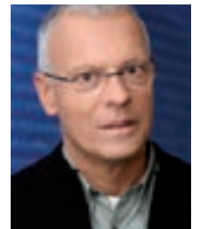
Charles Clerc, ehemaliger Redaktor und Moderator Tagesschau 16 Jahre war Charles Clerc als Redaktor und Moderator der Tagesschau beim Schweizer Fernsehen tätig. Sein Markenzeichen war jeweils sein Schlusssatz «Und zum Schluss noch dies ...».