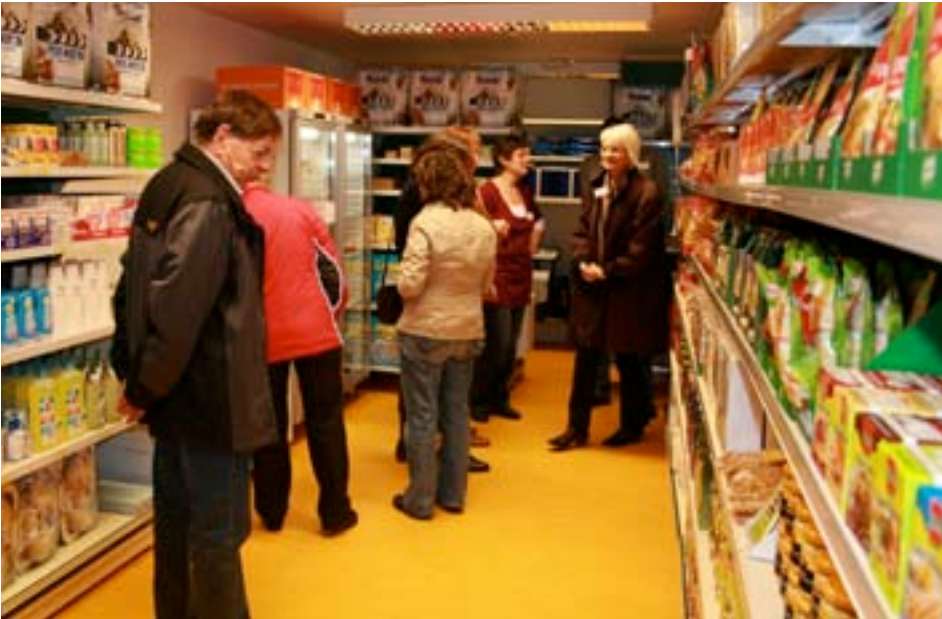
Eröffnung Caritas-Markt in Sursee, 19. und jüngster Lebensmittelladen der Caritas-Markt-Kette

Drehscheibe Caritas-Warenzentrale: Im luzernischen Rothenburg werden die Produkte, die in den Caritas-Märkten verkauft werden, akquiriert, bestellt, gelagert und von hier aus in Zusammenarbeit mit einem Transportunternehmen in die ganze Schweiz verteilt.